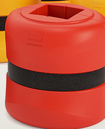
KP200 H 500 mm