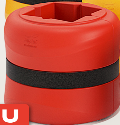
KP300 H 500 mm