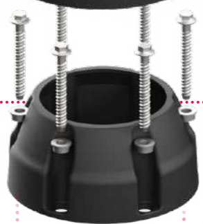
REWOLUCYJNA PŁYTA MONTAŻOWA

Śruby mocujące okrągłą płytę montażową do podłogi są chronione przez Base Defender. Ta gumowa osłona fizycznie uniemożliwia najechanie na płytę i uszkodzenie śrub. Aby uzyskać bardziej elegancki wygląd, należy przykryć osłonę podstawy za pomocą Base Shield (opcjonalnie). Zapewnia to dodatkową ochronę przed uderzeniami z poziomu gruntu oraz higieniczną ochronę przed brudem i kurzem.