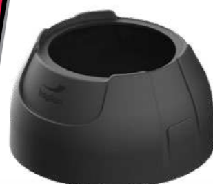
BASE SHIELD (OPCJONALNIE) (przejdź do akcesoriów)